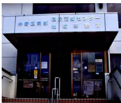
東部区民活動センター正面