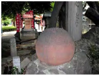
中野氷川神社南側参道の機雷

が戦争をして日本が勝利したとき、戦利品として持ち帰り、あちこちの神社に奉納したそうです。明治40年の事。しかし、太平洋戦争のときに金属が不足し供出してしまい、ほとんどの神社の機雷はなくなつてしまいましたが、どういふわけか中野氷川神社の機雷は残りました。事情を知っている人が居なくなり、その訳は謎のままです。