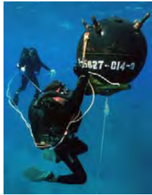
機雷：海に仕掛けられた爆弾