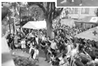
ファイナーレじゃんけん大会