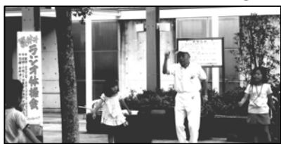
夏休み恒例のラジオ体操