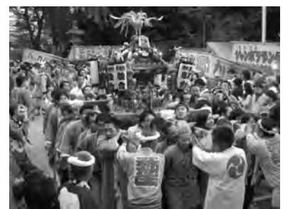
9月18日氷川神社祭礼 東中野連合宮入りの様子

支援を頼みたい方は、 電話 336312949 (月、金、10時~12時) にお電話をください。