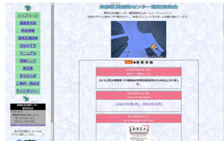
ホームページトップ画面はこんな感じ

東部区民活動センター運営委員会は平成24年7月にホームページ検討会を立ち上げ、約8ヶ月間の検討を行い、翌年3月開設しました。 最初は何を発信していけばいいのか手探りで議論を進め、運営委員会からの情報発信・活動記録・地域の情報発信・町会の活動情報を発信することに決定しました。 現在は最新情報を発信しつつ、これまでに発行された『はなみずき』や便利マップを全て見ることができ、データベース的な役割